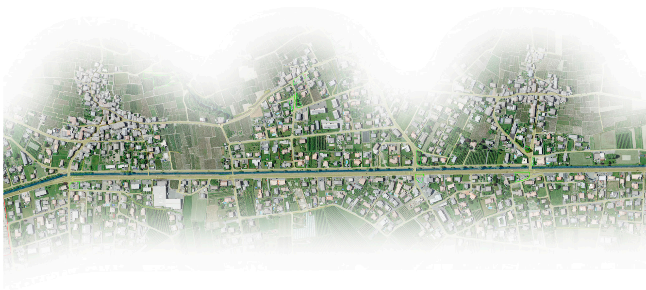
Séquence Châtaignier, Saxé et Mazembroz, nomad,2021