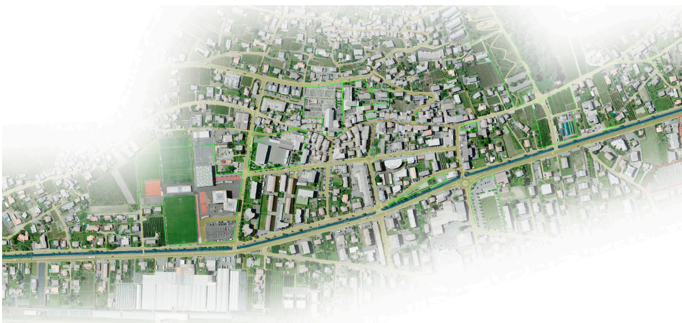
Séquence Vers l'Église, nomad, 2021