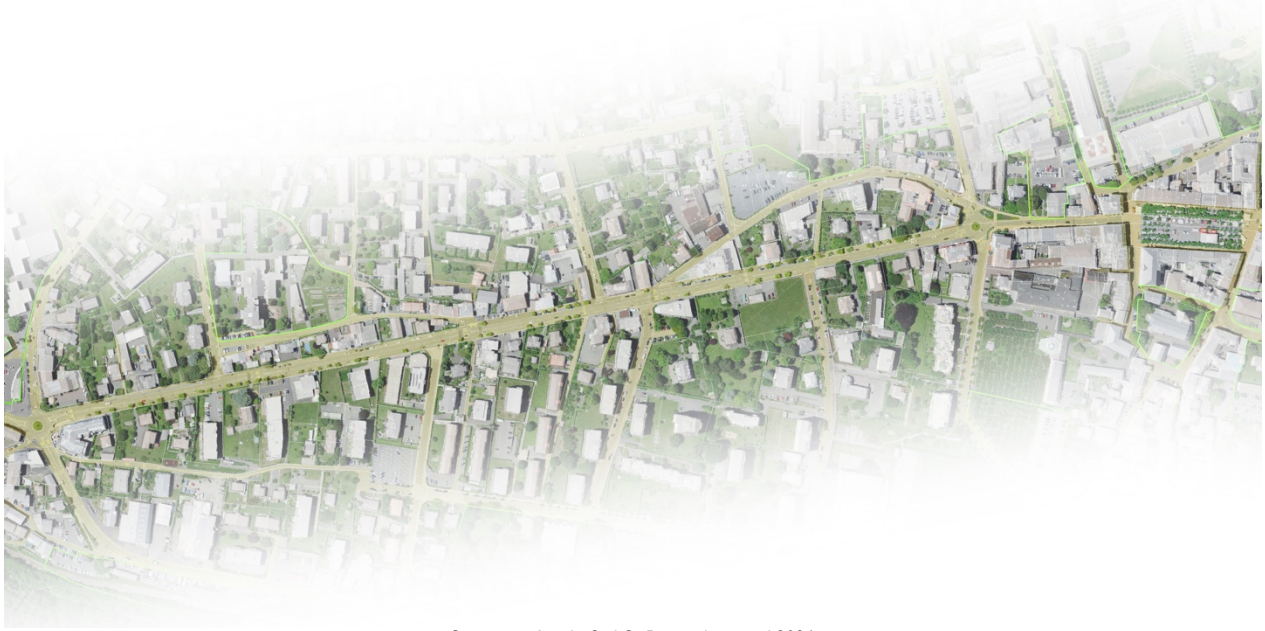
Séquence Av. du Grd-St-Bernard, nomad,2021