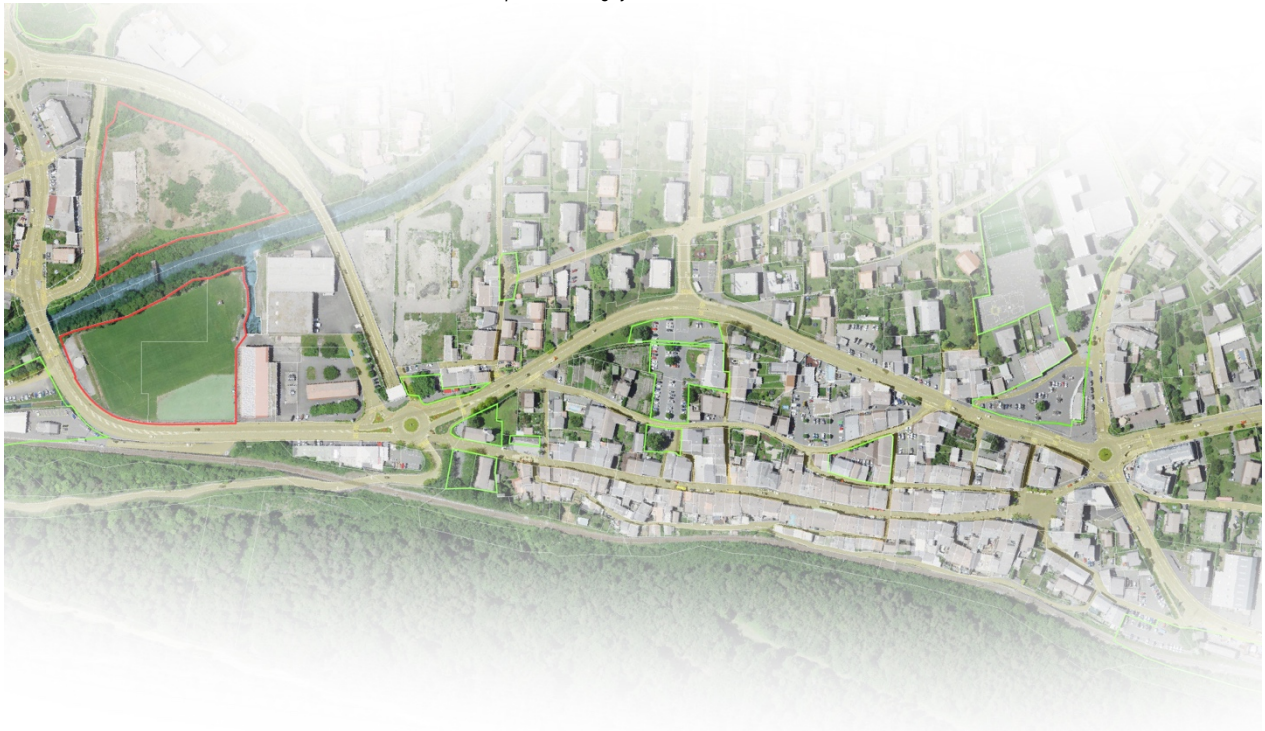
Séquence Martigny-Bourg, nomad,2021