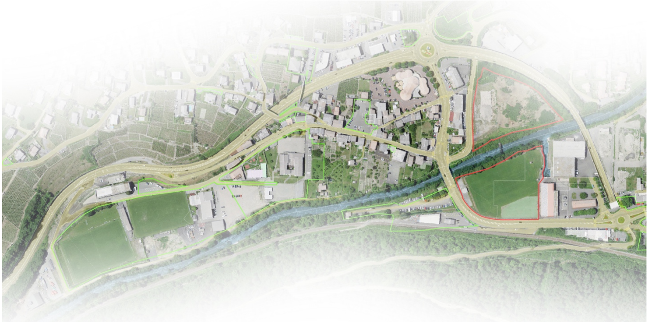
Séquence Martigny-Croix, nomad,2021