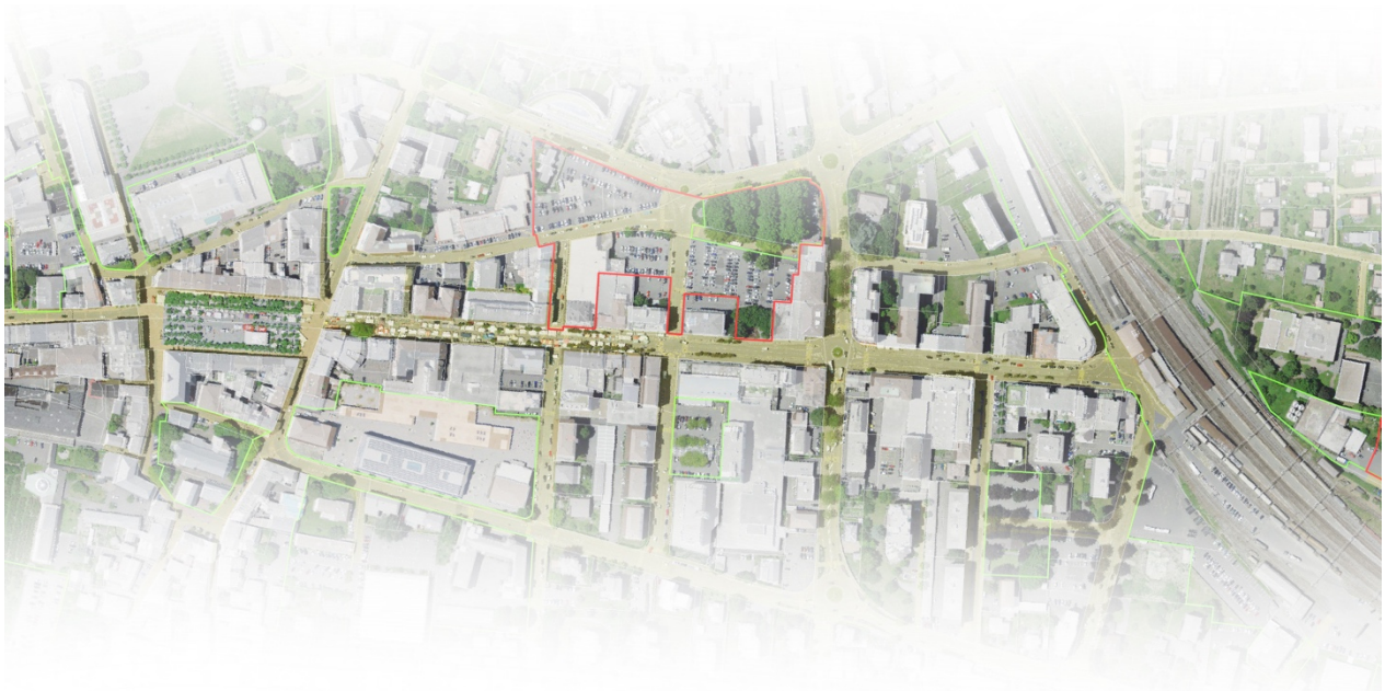
Séquence Av. de la gare, nomad,2021